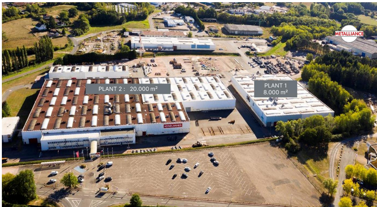
Gaussin | New Plant 13,6 hectares Dedicated to ATM & APM production for European market

GAUSSIN (EURONEXT CROISSANCE ALGAU - FR0013495298), pionnier du transport propre et intelligent dédié aux biens et aux personnes, annonce l'accroissement de ses capacités de production avec l'installation d'un nouveau site de 28 000 m 2 à Saint Vallier, en Saône-et-Loire. Il sera dédié à la production des véhicules ATM® logistique et APM® portuaire afin de répondre à la hausse de la demande sur les marchés européen et américain notamment. Ce nouveau site renforce également l'ancrage territorial historique du Groupe.