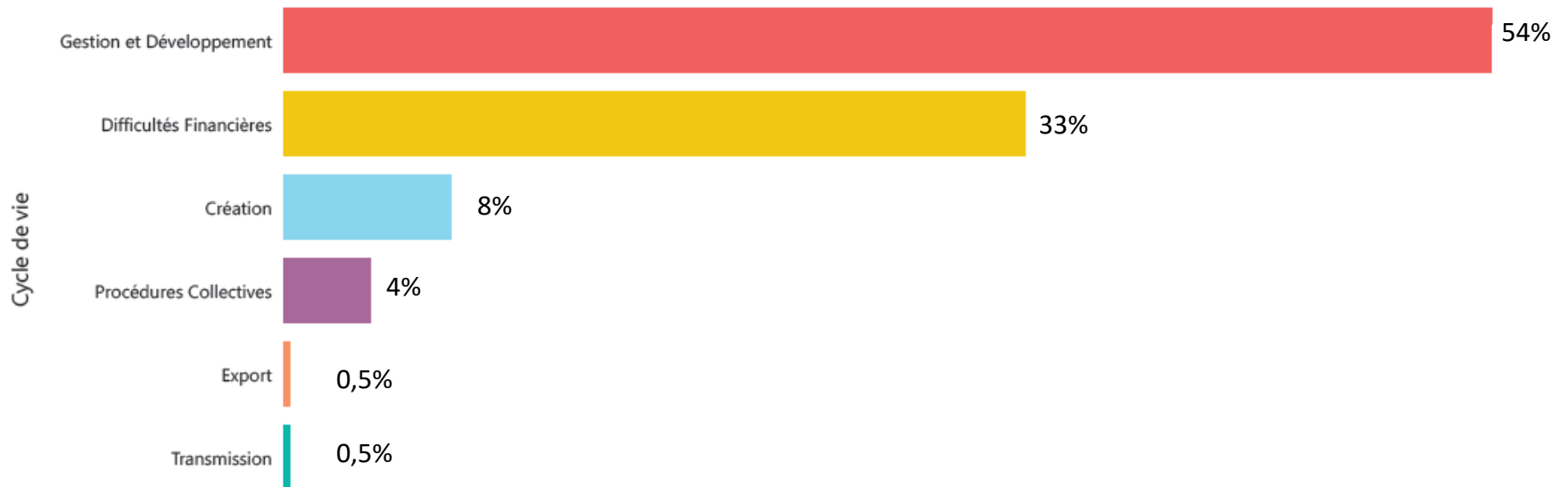
Nombre de besoins exprimés par "Cycle de Vie" [Global]