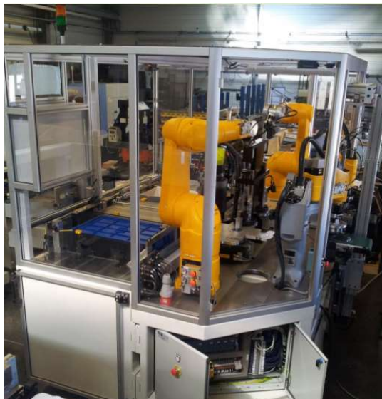
Cellule de contrôle et de conditionnement robotisée, en sortie de presse