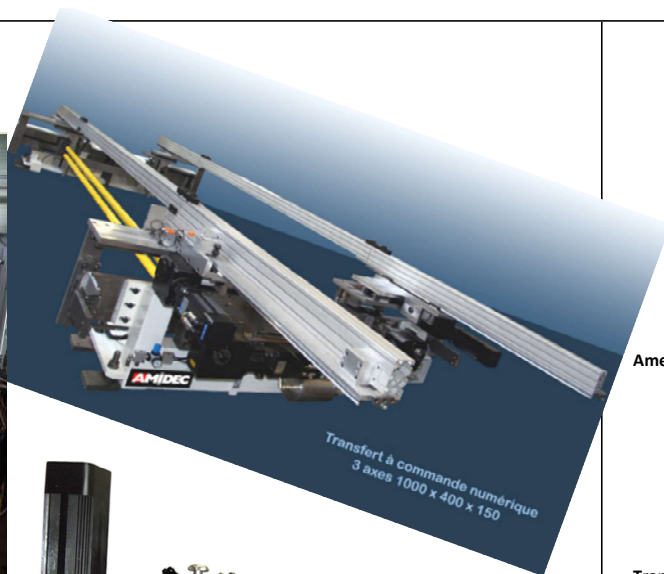
Transfert à commande numérique 3 axes 1000 x 400 x 150